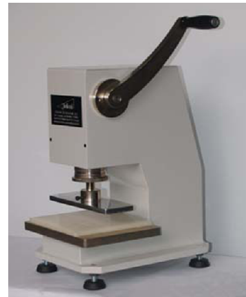
Manuale mod. IG/FM03