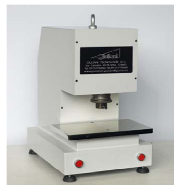
Pneumatica mod. IG/FP/MF/04