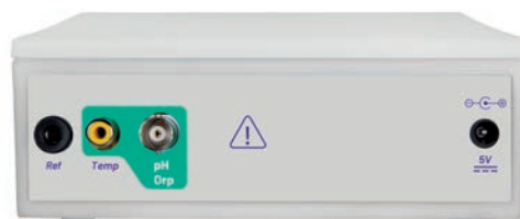
Pannello posteriore pH 50 Violab

Il segnalatore LED permette di tenere sempre sotto controllo lo stato dello strumento.