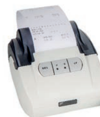
Stampante RS 232