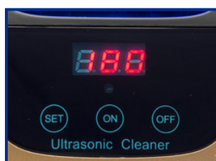
Pannello di controllo