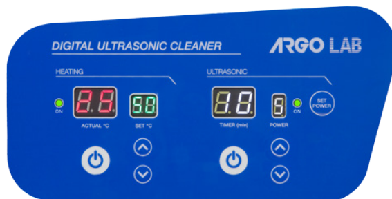
Pannello frontale serie DU