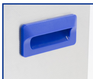
Maniglia per il trasporto