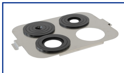
Supporto Becker per DU-100