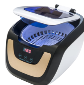
CE-5700A con cestello standard

L'intuitività e la sua versatilità di utilizzo lo rendono un elemento indispensabile per ogni laboratorio.