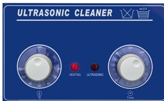
Pannello frontale serie AU