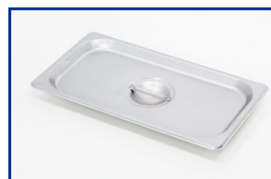
Coperchio in acciaio inox