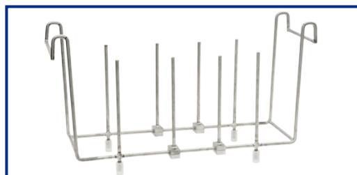
SS-200 supporto per la pulizia dei setacci (solo mod. AU-450)

* Tutti i supporti per becker sono forniti con anelli in plastica diam: 91,7 - 72,0 - 52,0 - 32,5 mm