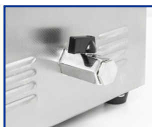
Valvola di scarico per i modelli DU-100 e AU-450