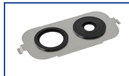
Supporto Becker per DU-45; DU-65; AU-65