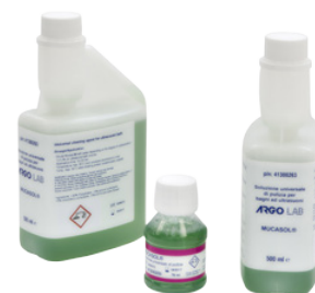
Soluzioni di pulizia universale